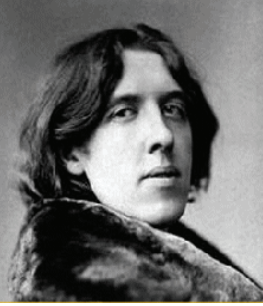
Voor de modebewuste FC'er; hij staat al jaren op je t-shirt!

Op een nieuwe productie mogen we dus nog even wachten. Ergens in januari de première van "Welkom in het Bos" en in het voorjaar volgt "Het Belang van Ernst".